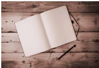
Mylène Bédard Université Laval

Les multiples visages de la propagande et de la désinformation