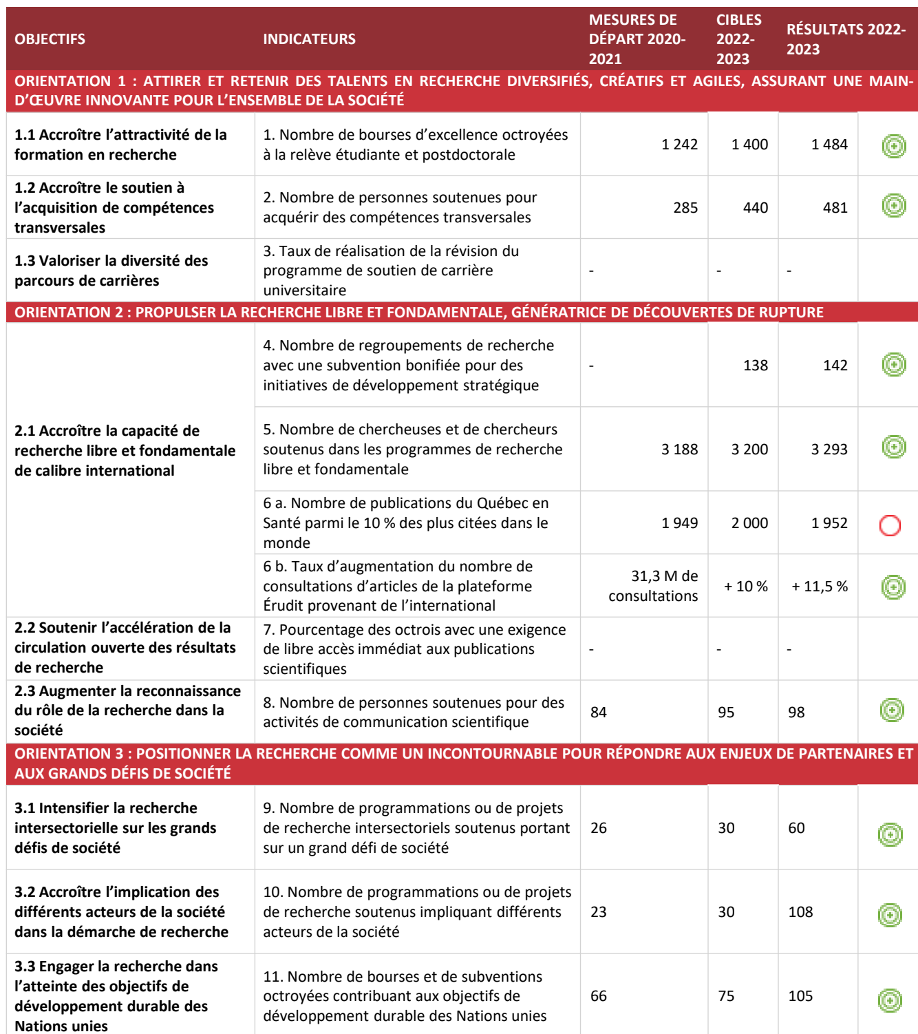
Tableau de bord du plan stratégique